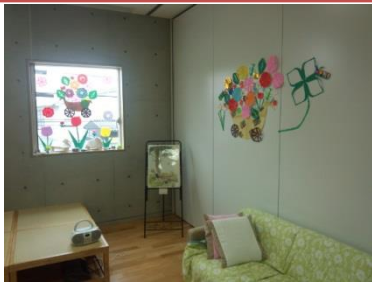
過ごし方は、あなた次第です

へきなん福祉センターあいくる内 碧南市社会福祉協議会 地域福祉課 〒447-0869 碧南市山神町 8-35 電話 0566-46-3701 FAX 0566-48-6522 e-mail soudanshien@hekinan-shakyo.jp