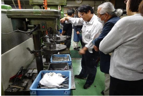
【昨年の見学先：(有)進工舎】 金属部品加工作業の様子