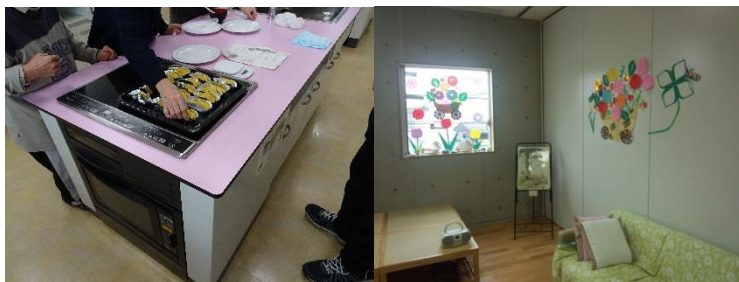
お菓子作りをみんなで行いました