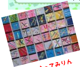
はってみりん せんをはって 「せんのだいり」