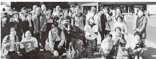
療育事業 バス旅行

碧南市手をつなぐ育成会は、会員相互の連携を図り、知的障がい児者、発達障がい児者の自立更生と福祉増進に貢献することを目的とした知的障がい児者、発達障がい児者及び関係者が組織する団体です。