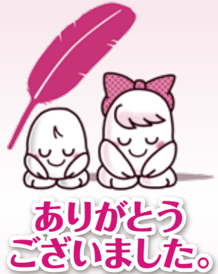
令和7年度 共同募金実績