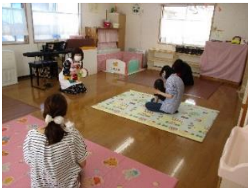
《親子でリトミック》