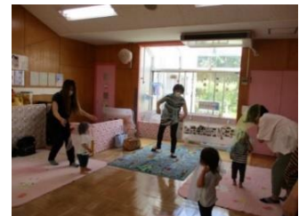
《親子でわらべうた》