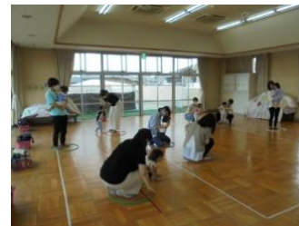
《リトミックスキンシップ》