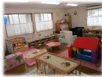
たな子育て支援センター すくすくひろば