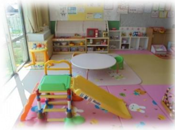
にしばた子育て支援センター わくわくひろば