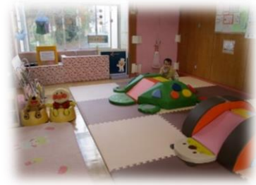
あらこ子育て支援センター ころころひろば